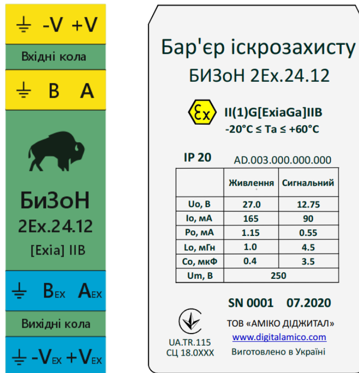
Рисунок 1 - Зовнішній вигляд маркування бар'єру іскрозахисту БИЗОН-2Ex

6.2 Контакти роз'ємів виділені і позначені додатково.