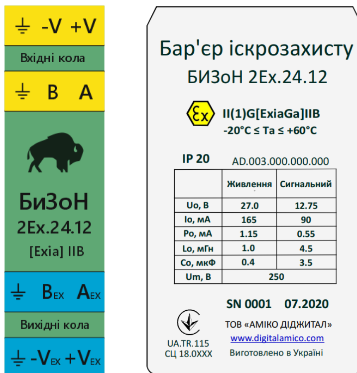
Рисунок 1 – Внешний вид маркировки барьера искрозащиты БИЗОН-2Ex