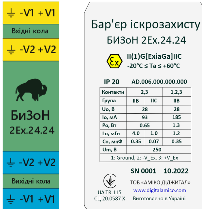
Малюнок 1 - Зовнішній вигляд маркування бар'єру іскрозахисту БИЗОН 2Ex